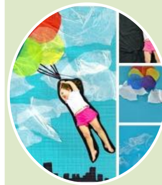
CENTRO PREFERENTE ALUMNADO T.E.A.